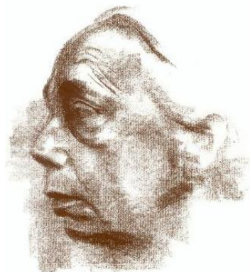
Käthe Kollwitz 1867 – 1945

„Käthe Kollwitz wollte wirken, nicht um des Erfolges willen, sondern aus innerer Notwendigkeit heraus und um einzugreifen in ihre Zeit; sie wollte nicht dürres Blatt am absterbenden Baum sein.“